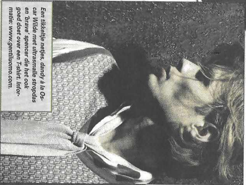
Een tikkelijfje netjes, dandy à la Oscar Wilde met ultrasmalle stropdas en 'brave' spencer die het ook goed doet over een T-shirt. Informatie: www.gentiluomo.com .